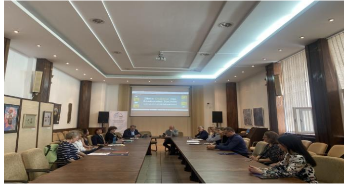
Autori: Conf. Univ. Adina Rebeleanu, Ruxandra Dobre

tuturor actorilor locali angajați în dezvoltarea locală, prin dezvoltarea parteneriatelor și acțiunilor conjugate între structuri de economie socială, instituții publice, comunități, mediul de afaceri și cel universitar.